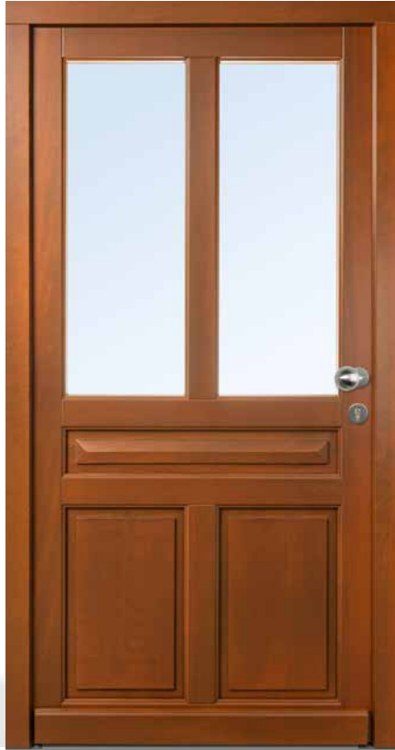
AH 94429 • Rahmenkonstruktion • Holzart Kiefer • Lasur Afrormosia 625 • Karniesprofil am Flügel • glasteilende Sprosse 98 mm • oben Glasfelder • unten Brüstungsplatten als Einsatzfüllung mit Zierprofil bzw. flacher Kassette außen • mit Holzwetterschenkel • S2150 Edelstahl-Knauf

Wenn sie von PaX kommen, dann machen die handwerkliche Qualität und das edle Design Holztüren zu etwas Besonderem.