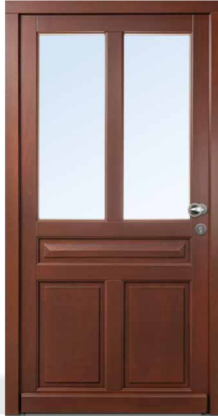
AH 94429 • Holzart Kiefer • Lasur Nussbaum 628