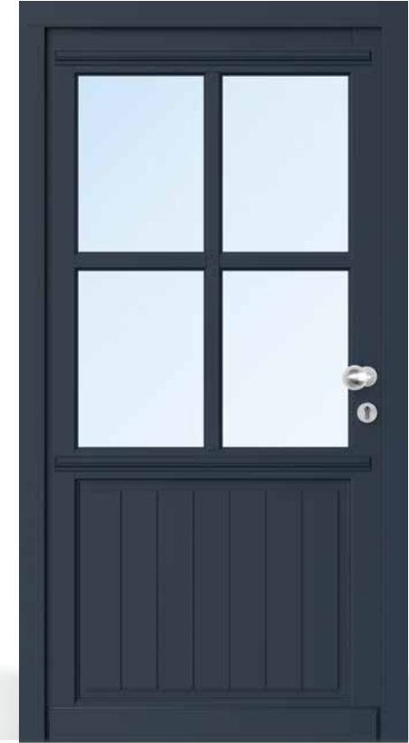
AH 94419 • Rahmenkonstruktion • Holzart Kiefer • Stahlblau RAL 5011 • Karniesprofil am Flügel • Aufbauprofil 40 mm oben • eine waagerechte glasteilende Sprosse 98 mm • oben Glasfeld mit 54 mm glasteilendem Sprossenkreuz • unten Brüstungsplatte als Einsatzfüllung • außen senkrecht genutet • zwei Zierprofile außen • mit Holzwetterschenkel • S2150 Edelstahl-Knauf