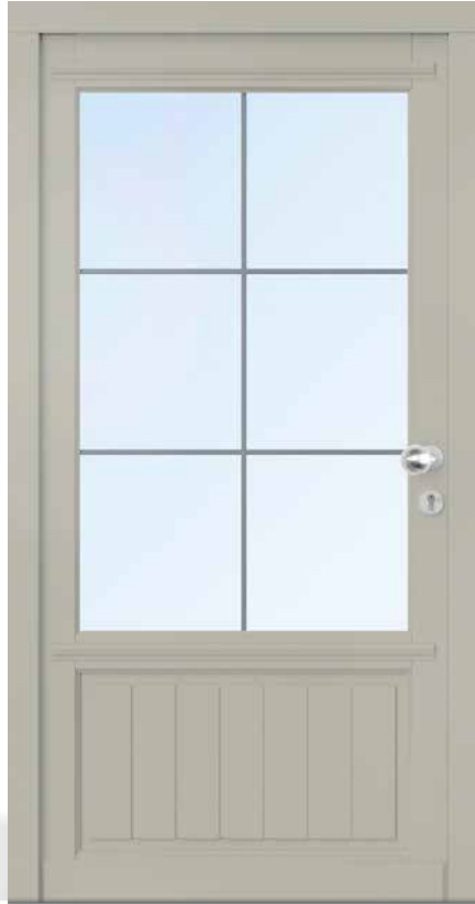
AH 94116 • Holzart Kiefer • Seidengrau RAL 7044