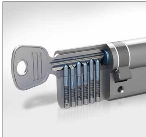
Profilzylinder mit Not- und Gefahrenfunktion

* Das Aktionsangebot gilt bis zum 31.12.2025. Technische Änderungen vorbehalten.