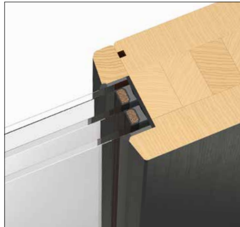
3-fach-Wärmeschutzglas U_g 0,7 W/(m 2 K)