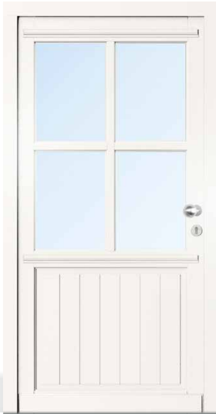
AH 94419 • Holzart Kiefer • Verkehrsweiß RAL 9016