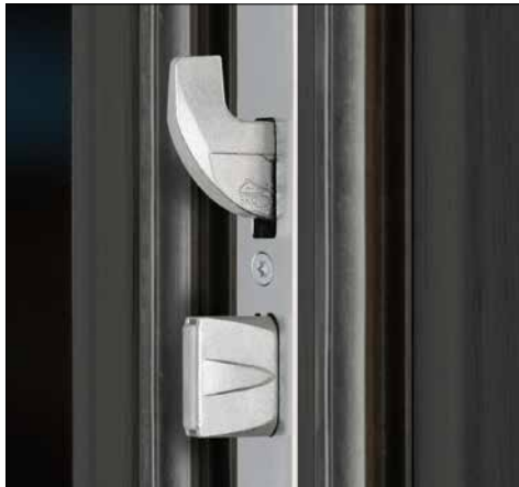
◀ 5-fach-Verriegelung schon in der Standardausstattung