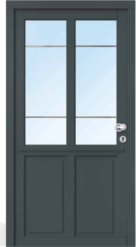
AH 94309 • Holzart Kiefer • Basaltgrau RAL 7012