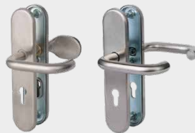
Edelstahl-Langschildgarnitur G0241 • Wechselgarnitur G0261 • Drückergarnitur