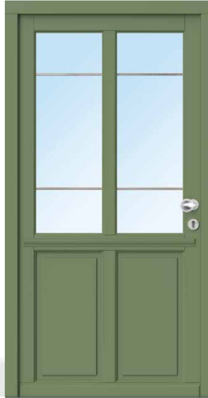
AH 94309 • Rahmenkonstruktion • Holzart Kiefer • Resedagrün RAL 6011 • Karniesprofil am Flügel • eine waagerechte glasteilende Sprosse 98 mm • senkrechte glasteilende Sprosse 78 mm • oben Glasfelder mit Bleisprossen 12 mm glatt • unten Brüstungsplatten als Einsatzfüllung, außen mit flacher Kassette, Zierprofil außen • mit Holzwetterschenkel • S2150 Edelstahl-Knauf